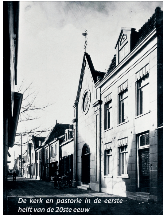
De kerk en pastorie in de eerste helft van de 20ste eeuw

digende en beschermde karakter van de toegang. Deze rondboog, voortkomend uit Romaanse architectuur, rust op een kroonlijst als kalf, de overgang vormend van gevel naar plafond en zijdelings 'ondersteund' door vooruitstekende architraven. Beide hoeken van de kerk hebben weinig uitspringende pilasters of lisenen, die aan de top bekroond worden door neogotische penanttoertjes. Het front eindigt aan de bovenzijde als schoudergevel en kent een keperafdekking waaronder klimmende boogfriezen zijn gemaakt. De topgevel wordt bekroond door een