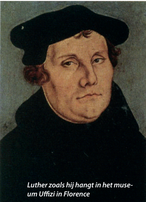
Luther zoals hij hangt in het museum Uffizi in Florence