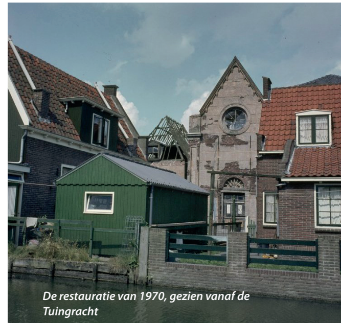
De restauratie van 1970, gezien vanaf de Tuingracht

De beide zijgebouwen vertonen een ingetogen karakter en staan bijna gelaten naast hun grote broer. De vensters bevatten een kleine roedeverdeling die in de loop der tijd in grootte wisselden. Oorspronkelijk konden de vensters worden afgesloten door zonnerakken. De gevels van beide zijgebouwen werden afgesloten met kroonlijst als goot waarop een dakkapel kwam, afgedekt met een timpaantje.